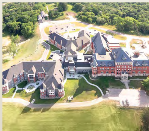
Mount Carmel Bluffs a partir del verano de 2021